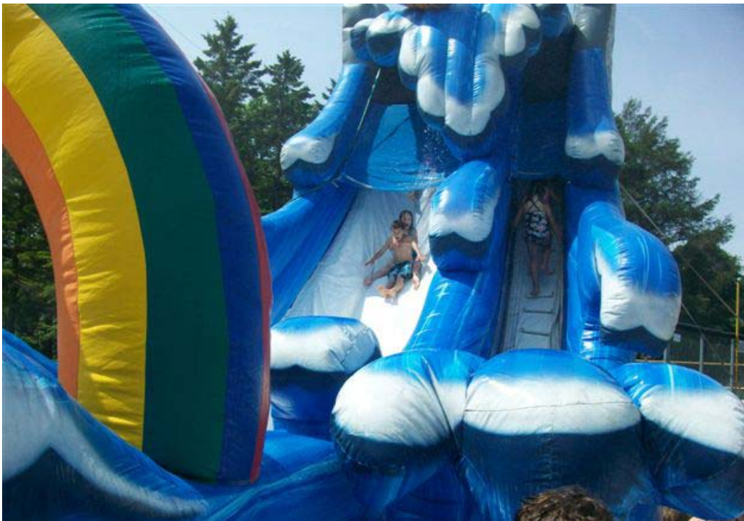
Activité jeu d'eau du Camp de jour